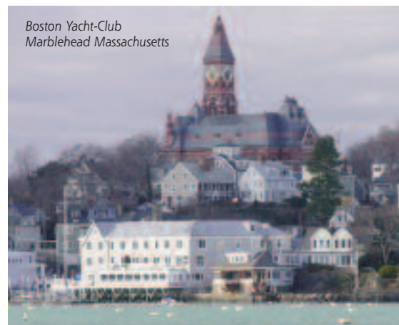
Boston Yacht-Club Marblehead Massachusetts