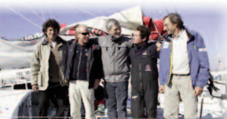
Les 5 premiers du Vendée Globe 08/02/05

En relation avec la course autour du monde du Vendée Globe